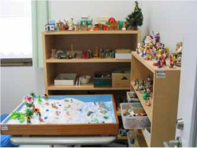
板橋相談室 箱庭コーナー