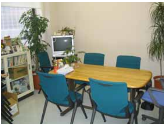
東松山 第1学生相談室