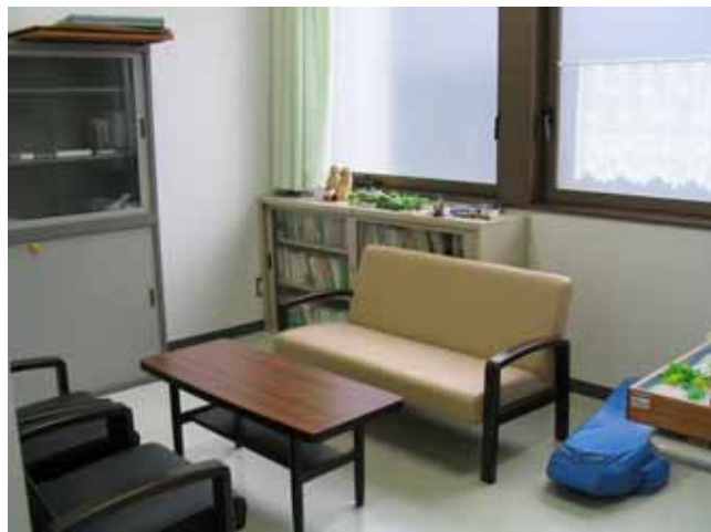
板橋相談室 第2面接室