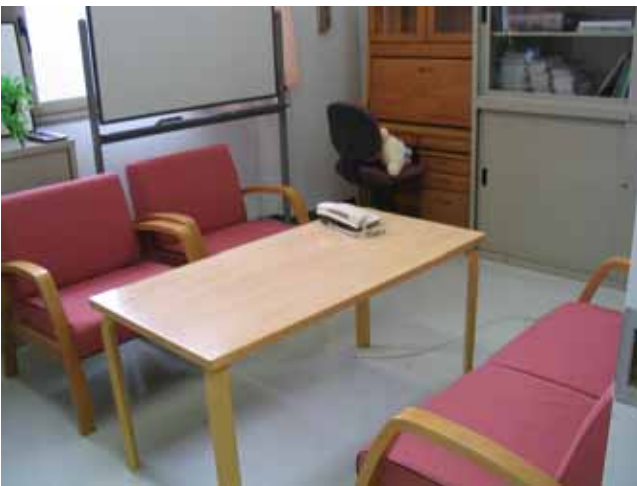
板橋相談室 第1面接室