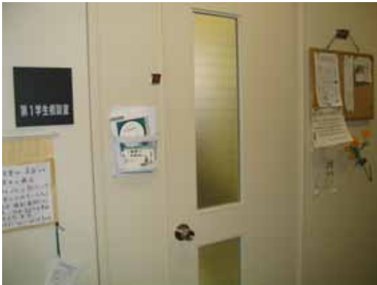
東松山学生相談室 入口