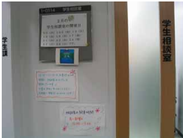
板橋学生相談室 入口