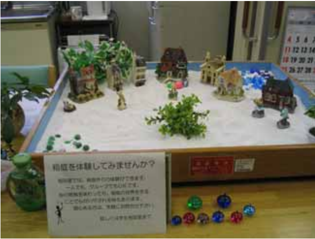
東松山相談室 箱庭体験の勧め