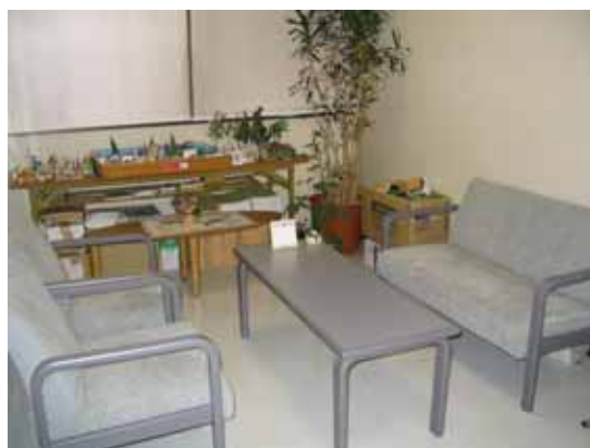
東松山 第2学生相談室