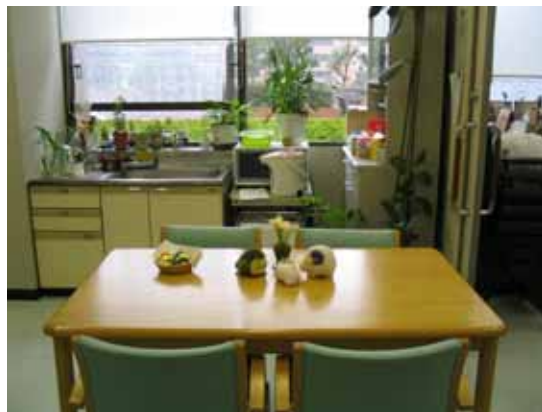
東松山学生相談室 受付